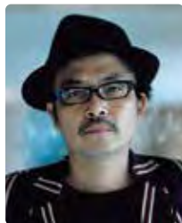
ディレクター 園子温 豊橋ふるさと大使 映画監督

名だたる映画監督や俳優・女優を輩出し、街のあちこちで撮影が行われ…と、「映画の街」になりつつある愛知県・豊橋市。この地域にゆかりのある俳優・女優や監督などが一堂に会する、豊橋ならではの映画祭です。ぜひ皆さんでお楽しみください!