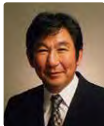
コンペティション 審査委員長 杉田成道 豊橋ふるさと大使 映画監督