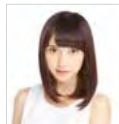
MC 桃月なしこ 女優 コスプレイヤー