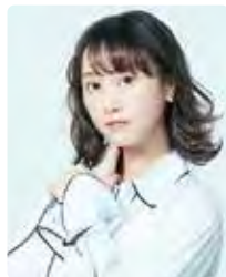
アンバサダー 松井玲奈 豊橋ふるさと大使 女優